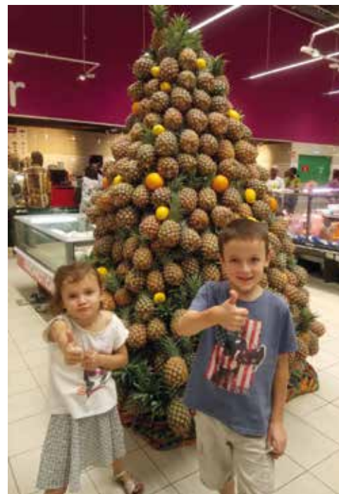
Noël en Côte d'Ivoire, le sapin ananas.