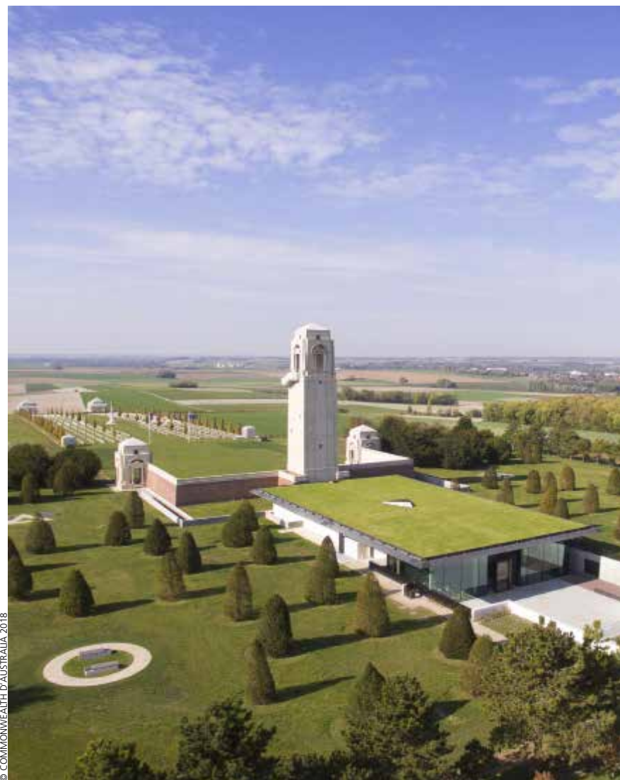
Le centre Sir John Monash à Villers-Bretonneux.