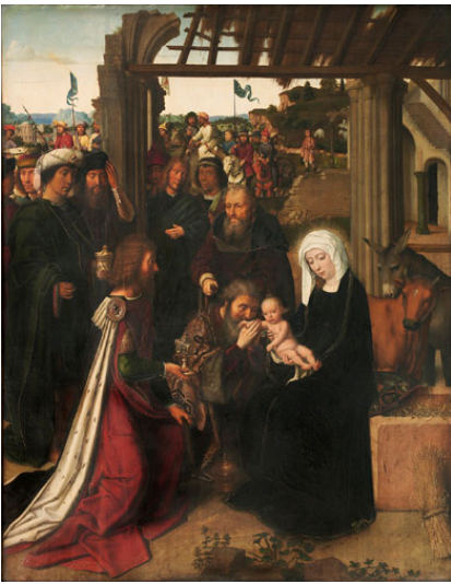
Gerard David L'adoration des mages

Musées royaux des Beaux-arts de Belgique, Bruxelles