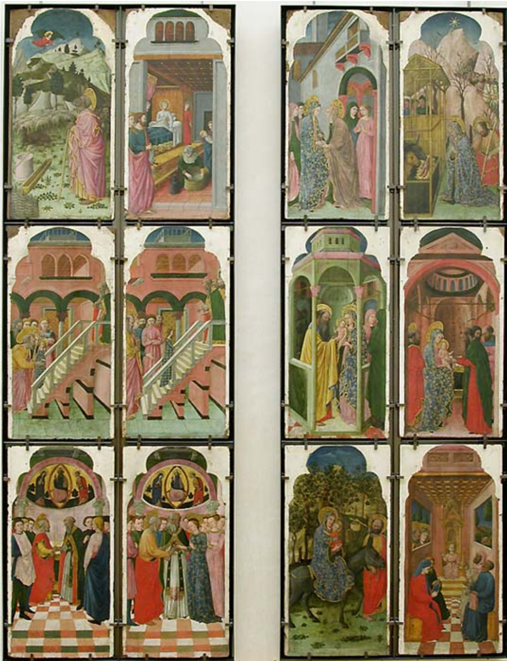
Ancienne collection Campana, Rome Entré au Louvre en 1863