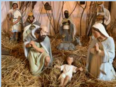
De village en village, les crèches éclairées ont animé les places.

Une dizaine de bénévoles se sont affairés autour de l'élaboration de la crèche et d'un village de Noël. L'église Saint-Cyr-et-Sainte-Julitte, ouverte pour quatre soirées dans une ambiance musicale de Noël, a été visitée par deux cent vingt personnes. Un livre d'or a mémorisé la joie des gens du village qui ont pu découvrir ce beau patrimoine de chez eux !