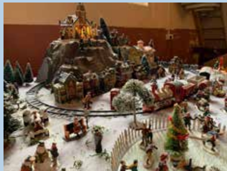
Le village de Noël.