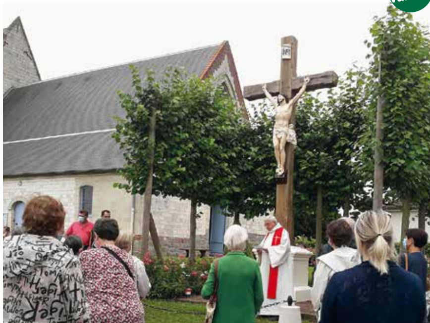
À Querrieu, le calvaire restauré.

L es calvaires de nos villages, calvaire de cimetière ou d'ancien cimetière autour des églises, croix de mission, calvaires de pèlerinage ou de chemin marquent nos paysages ruraux. Souvent enclos dans un carré végétal taillé, ils rappellent l'histoire des communautés (épidémies, missions). Le Christ sauveur du monde par sa croix est présent au sein de notre monde souffrant.