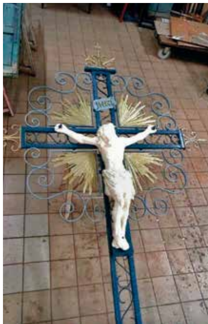
À Corbie, calvaire du choléra en cours de restauration.