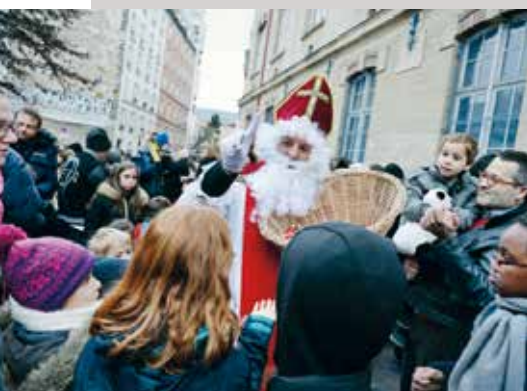
Fête de Saint-Nicolas, avec distribution de friandises aux enfants à la paroisse Saint-Jean-Baptiste de Belleville, Paris (2017).

Source : aleteia.org (sur les traditions de la Saint-Nicolas)