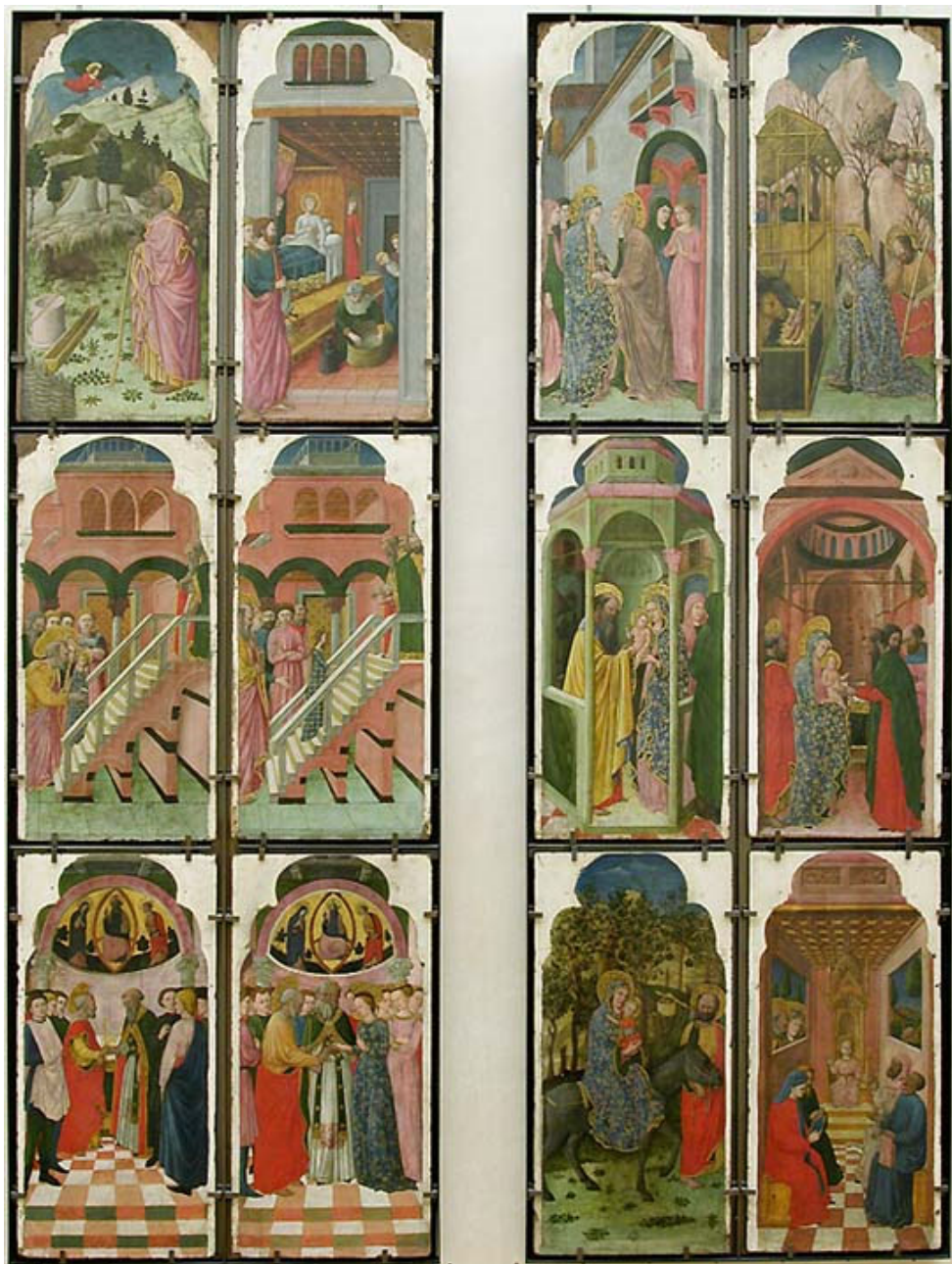
Ancienne collection Campana, Rome Entré au Louvre en 1863