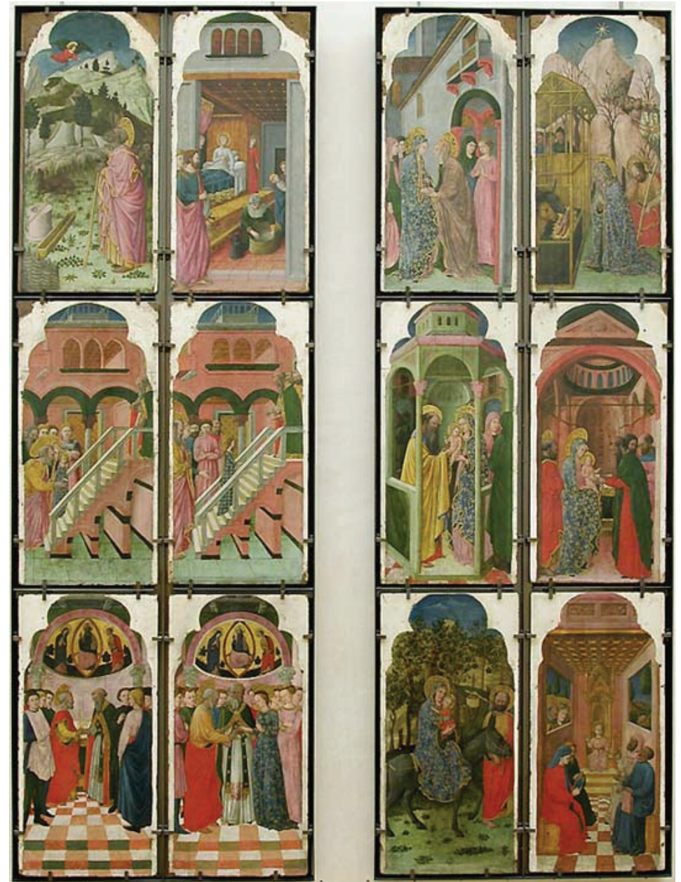
Ancienne collection Campana, Rome Entré au Louvre en 1863

Parole du Seigneur : Nous rendons grâce à Dieu.